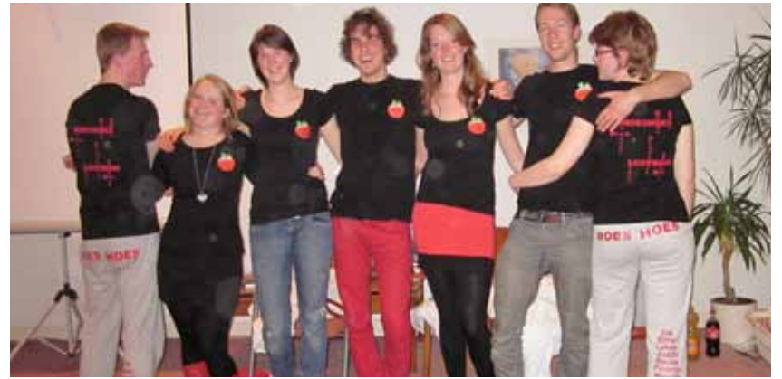
Lustrum Moeshoes, de huidige bewoners met hun huiskleding. Appel-moes.

Vijf jaar geleden vierden wij de stichtingsmaaltijd van het Moeshoes, een voormalig klooster in het centrum van Groningen. Ik was één van de eerste acht bewoners die daar de Belofte der Convivia mochten afleggen, waarvan ik de tekst nog steeds kan dromen en die mij misschien wel meer zegt dan mijn advocatenbelofte van twee jaar later. Een bijzondere dag dus, 18 maart 2007! De ceremonie begon met een viering in de huiskapel. Wij lazen het fascinerende verhaal uit Genesis 28 over de droom van Jakob. Daarin ziet hij op de aarde een ladder staan die tot in de hemel reikt: "en zie, engelen Gods klommen daarlangs op en daalden daarlangs neder." Als Jakob wakker wordt, realiseert hij zich dat hij op een bijzondere plaats heeft geslapen: "Waarlijk, de HERE is aan deze plaats, en ik heb het niet geweten." Hij richt een steen op, noemt de plaats Betel (huis van God) en legt een belofte af.