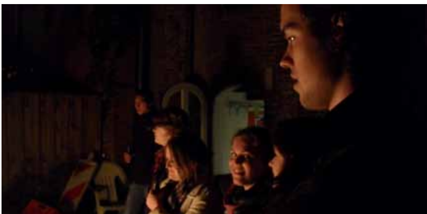
Lustrum Pakhuis London, mooie verhalen bij het kampvuur