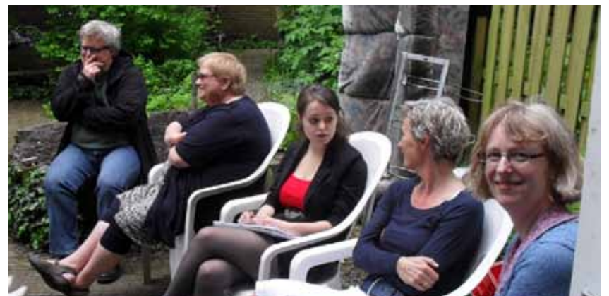
Ze zijn inmiddels ouder én grijzer, maar van binnen nog steeds een beetje student.