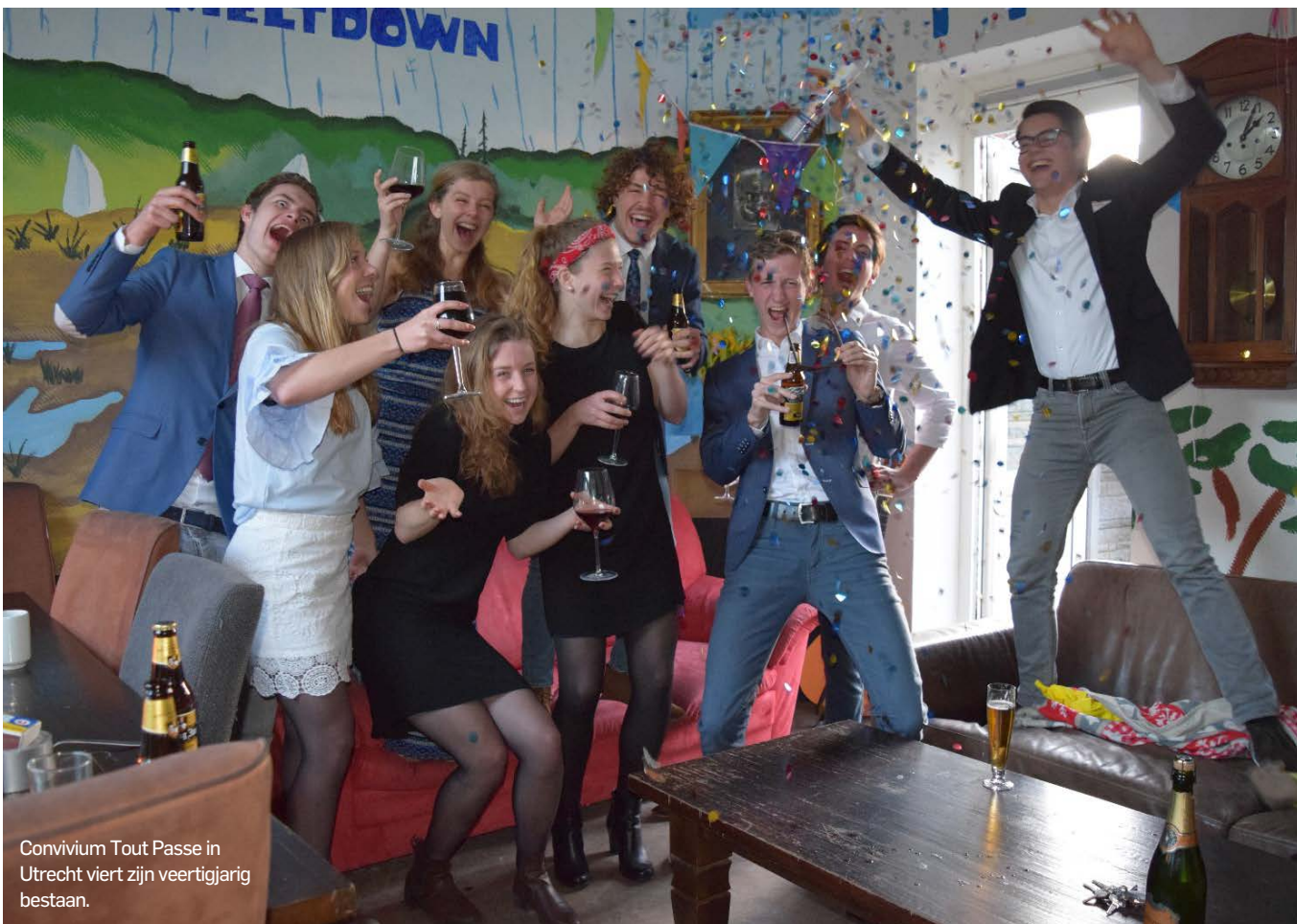
Convivium Tout Passe in Utrecht viert zijn veertigjarig bestaan.